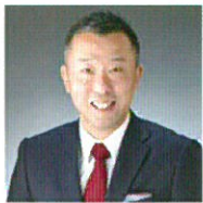
e-人事株式会社 代表取締役